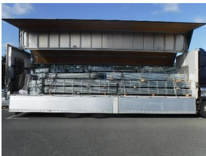
運搬コスト削減に貢献