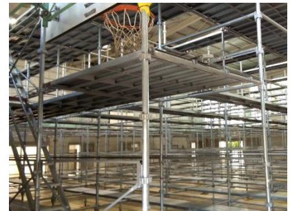
細かなピッチで設計可能