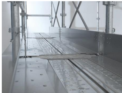
フラット・隙間レスな作業床