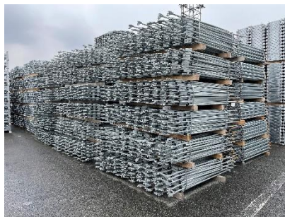
保管コスト削減に貢献