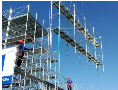
大組み・大払いで生産性向上